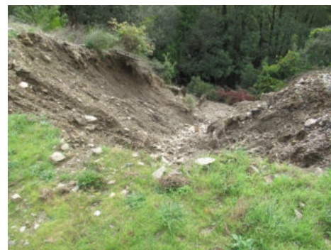
Chemin de la station suite aux pluies

Il est bien sûr entendu que tous les conseillers municipaux sont invités à porter secours si besoin était.